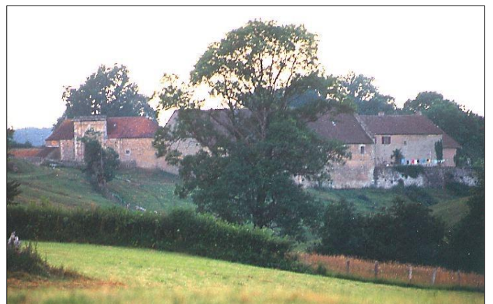
Les vestiges du château de Saillant