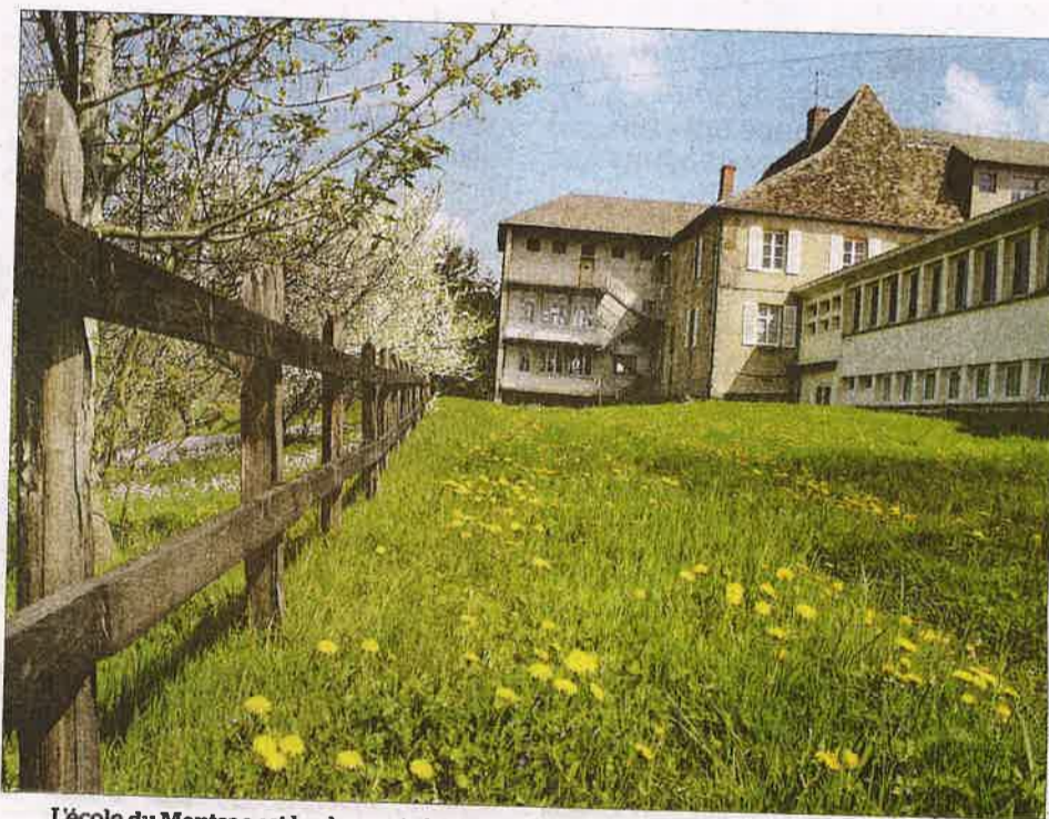
L'école du Montsac est le plus vaste bâtiment du village de Saint-Christophe-en-Brionnais. Depuis son arrivée, en 1991, le CEP a réussi à rénover et aménager plus de la moitié de ses locaux.

cinq ans d'interruption liée à la crise sanitaire du Covid. Le programme des Chemins du Roman qui vise à mettre en réseau plusieurs centaines d'églises romanes en Bourgogne du sud, va connaître un développement en accueillant les groupes d'étudiants et professeurs de quatre grandes universités internationales venues d'Europe, d'Amérique et d'Asie). Par ailleurs, comme chaque année le CEP organise son festival de musique irlandaise au début de l'automne les 3, 4 et 6 octobre 2024 : le festival celtique en voûte. Par ailleurs, le CEP a été missionné par les élus locaux pour porter la candidature des huit sites clunisiens du charolais brionnais au patrimoine mondial de l'UNESCO. "Pour cela nous allons embaucher un chargé de mission pour coordonner et animer tous éléments permettant à cette candidature d'aller jusqu'au bout avec l'aide des collectivités." précise Yvonne Bosché, directrice du CEP. Enfin, pour ces 35 ans, un grand colloque sur le sujet du patrimoine et de l'environnement dans un monde en crise aura lieu les 22 et 23 novembre au CEP.