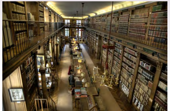
La bibliothèque de l'Institut de France