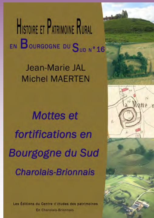
Couverture de la nouvelle brochure

C'est pourquoi le CEP vous convie à la découverte de ce patrimoine méconnu de notre région et publie ce nouveau numéro dans la collection "Histoire et Patrimoine rural".