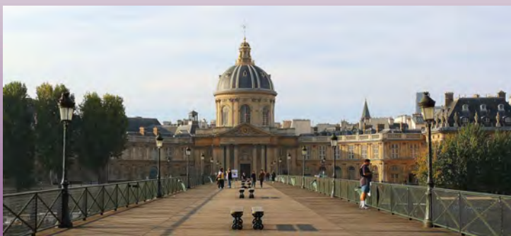
Vue générale de l'Institut de France