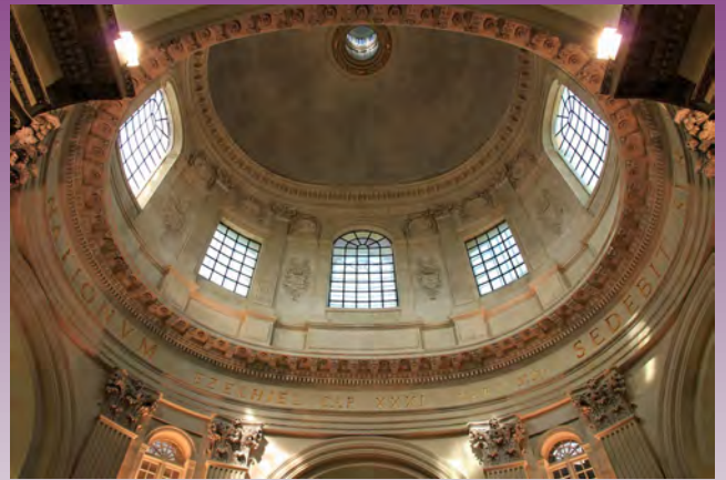
La coupole de l'Institut de France

L'Institut de France est né durant la Révolution française (loi du 4 brumaire, an V, le 25 octobre 1795, sous le Directoire). Il est domicilié quai Conti, à Paris, dans les magnifiques bâtiments de l'ancien Collège des quatre Nations. Il regroupe les plus grandes académies parmi lesquelles : l'Académie française, l'Académie des Inscriptions et Belles Lettres, l'Académie des sciences et l'Académie des Beaux-Arts. Un décret de 1832 y adjoindra l'Académie des Sciences morales et politiques. L'ensemble des 5 Académies forment l'Institut de France. Les séances publiques (une pour chaque Académie) se tiennent dans la salle des séances, ancienne chapelle édifée au 18 ème siècle par l'architecte Vaudoyer. La bibliothèque de l'Institut de France est l'une des plus grandes bibliothèques de France ; elle possède plus de 2 millions de livres, 100 000 brochures et 5000 périodiques, avec 5000 manuscrits. Cette bibliothèque encyclopédique n'a cessé de s'agrandir.