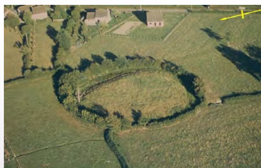
Photo aérienne de la motte de Saint-Bonnet-de-Vielle-Vigne