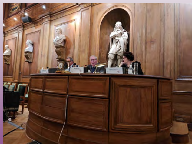
Les principaux membres du jury du CTHS (© Hannelore Pepke, décembre 2023)