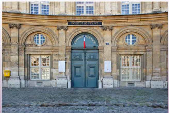
Entrée de l'Institut de France, quai Conti